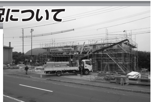
建設中の江良出張所

松前町江良地区の安心・安全な暮らしを守る活動の拠点として令和5年1月に完成予定であります。