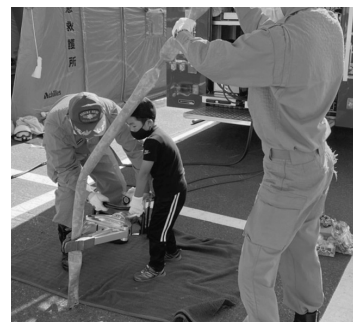
油圧救助資器材体験