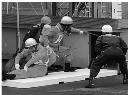
ほふく救出の様子