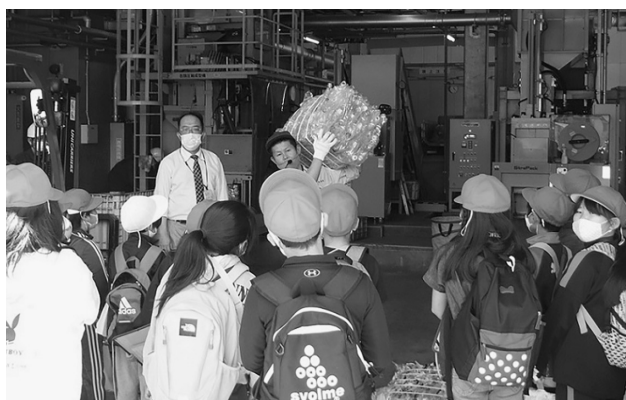
松城小児童のみなさん

来年以降も引き続き、リサイクルプラザの見学を受け付けておりますので、児童の皆さんのご来所をお待ちしています。