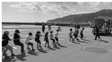
消防車との綱引き