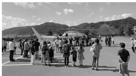
道南ドクターヘリ来場

海峡横綱ビーチ駐車場で放水体験や消防車・救急車の乗車体験、子供たちによる消防車綱引きなどが行われました。