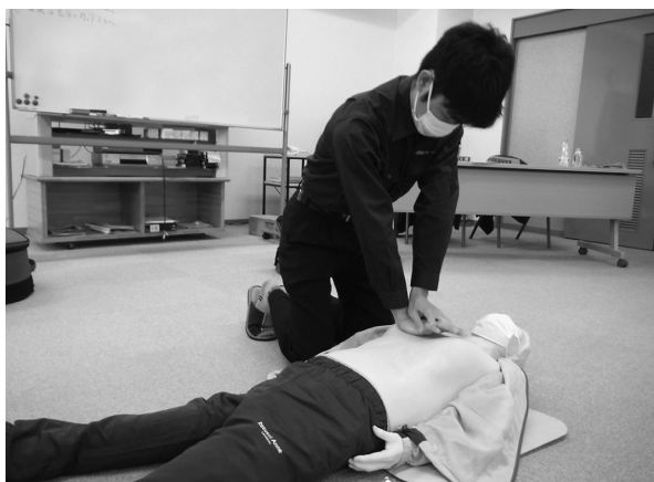
訓練を受ける職員

衛生センターではAEDを常備しておりますので、近くを通った際に必要がある場合は、当センター事務室までお声をかけて下さい。