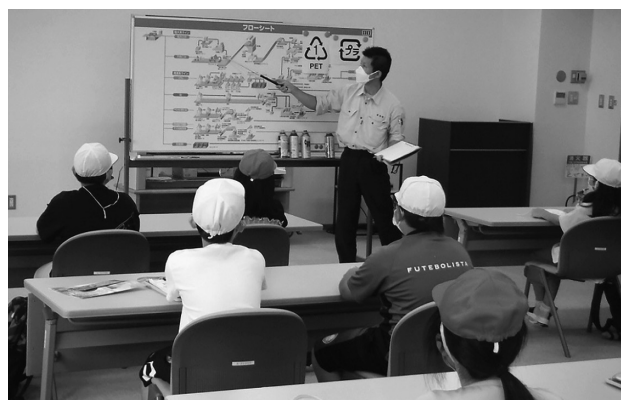
知内小・涌元小児童のみなさん