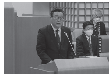
行政報告をする鳴海管理者

5月11日に木古内町木古内地区で、一般住宅から火災が発生しましたが、この火災による人的な被害はありませんでした。