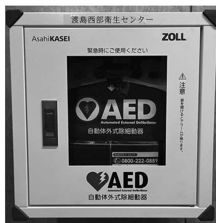
AED（自動体外式除細動器）