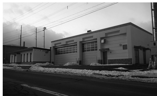
松前消防署江良出張所車庫部分