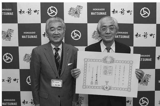
石山松前町長と木崎氏