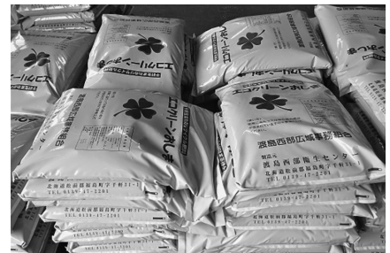
エコクリーンおしま

申込みは、衛生センターに直接、電話等で申込みください。（☎0139-47-2201）