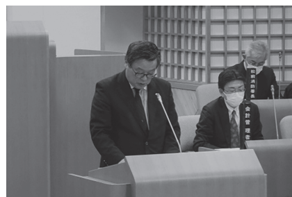
行政報告をする鳴海管理者

発見された行方不明者に外見的な異常は見受けられませんが、念のため救急搬送しております。