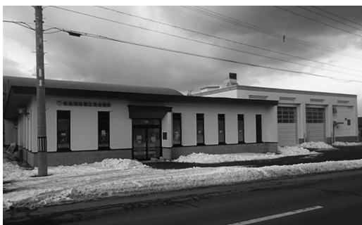
松前消防署江良出張所事務所部分

施設の構造については、事務所部分が木造で車庫部分が鉄筋コンクリート造の平屋建となっており、建築面積は379.52㎡であります。