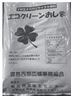
エコクリーンおしま

なお、し尿搬入量の減少によって、肥料生産数に影響が出ることや、予約件数によってはすぐにお渡しできない場合もありますので、ご理解のほどよろしく申し上げます。