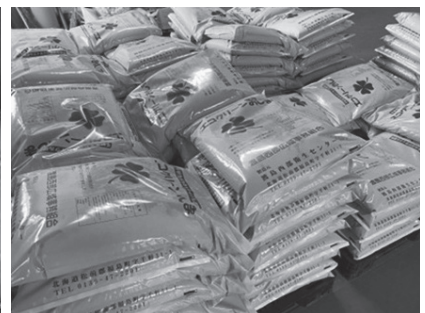
葉物野菜や花類に相性が良い (※作物に合わせて加里成分を補充すると効果高)