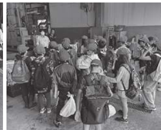
大島小学校4年生の皆さん 松城小学校4年生の皆さん 福島・吉岡小学校4年生の皆さん 知内小学校4年生の皆さん