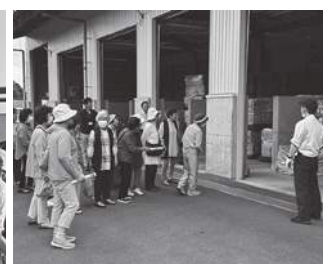
松前町いきいき教室の皆さん 福島町高齢者学級の皆さん 知内みらい大学の皆さん 木古内リロナイふれあい学園生の皆さん