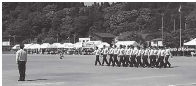
小隊訓練を実施する福島消防団